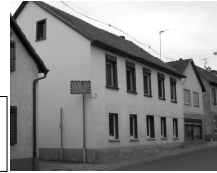
Hauptstr. 60 Liebmann