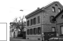
Hauptstr. 11 Mayer