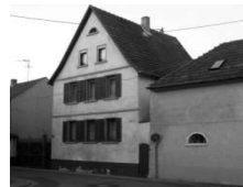
Alsheimerstr. 1 Hertz