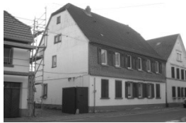
Hauptstr. 41 Wolf