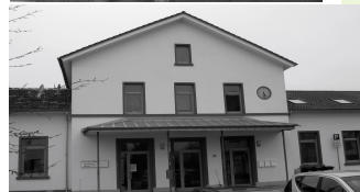
Bahnhof (Stolperstein in Zufahrt zu den Parkbuchten südl. des Bahnhofs) Maurer