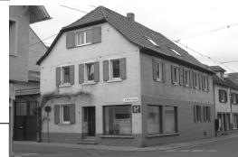
Hauptstr. 48 Deutsch/Wolf