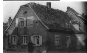
Bleichstr. 8 Grünewald