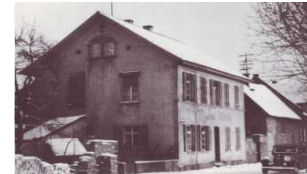
Wormser Str. 4 Rüb/Hartogsohn

24 Stolpersteine liegen in Guntersblum: an zwölf verschiedenen Stellen. Sie erinnern an das Schicksal der Guntersblumer, die im Nationalsozialismus ermordet, deportiert, vertrieben oder in den Suizid getrieben wurden. Stolpersteine sind ein Projekt des Künstlers Gunter Demnig. Er möchte den Menschen, die in den Konzentrationslagern zu Nummern degradiert wurden, ihre Namen zurückzugeben. Das Bücken, um die Texte auf den Stolpersteinen zu lesen, soll auch eine symbolische Verbeugung vor den Opfern sein. Trotz des Namens Stolpersteine geht es Demnig nicht um ein tatsächliches „Stolpern“. „Man stolpert mit dem Kopf und mit dem Herzen“.