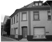
Mittelstr. 8 Monat