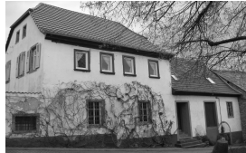
Julianenstr. 2 Vogel