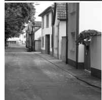
Grabenstr. 21 Kopf