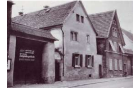
Hauptstr. 52 (alte Straßenansicht) Mayer