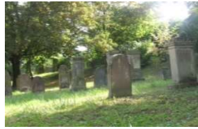
L 437 Jüdischer Friedhof